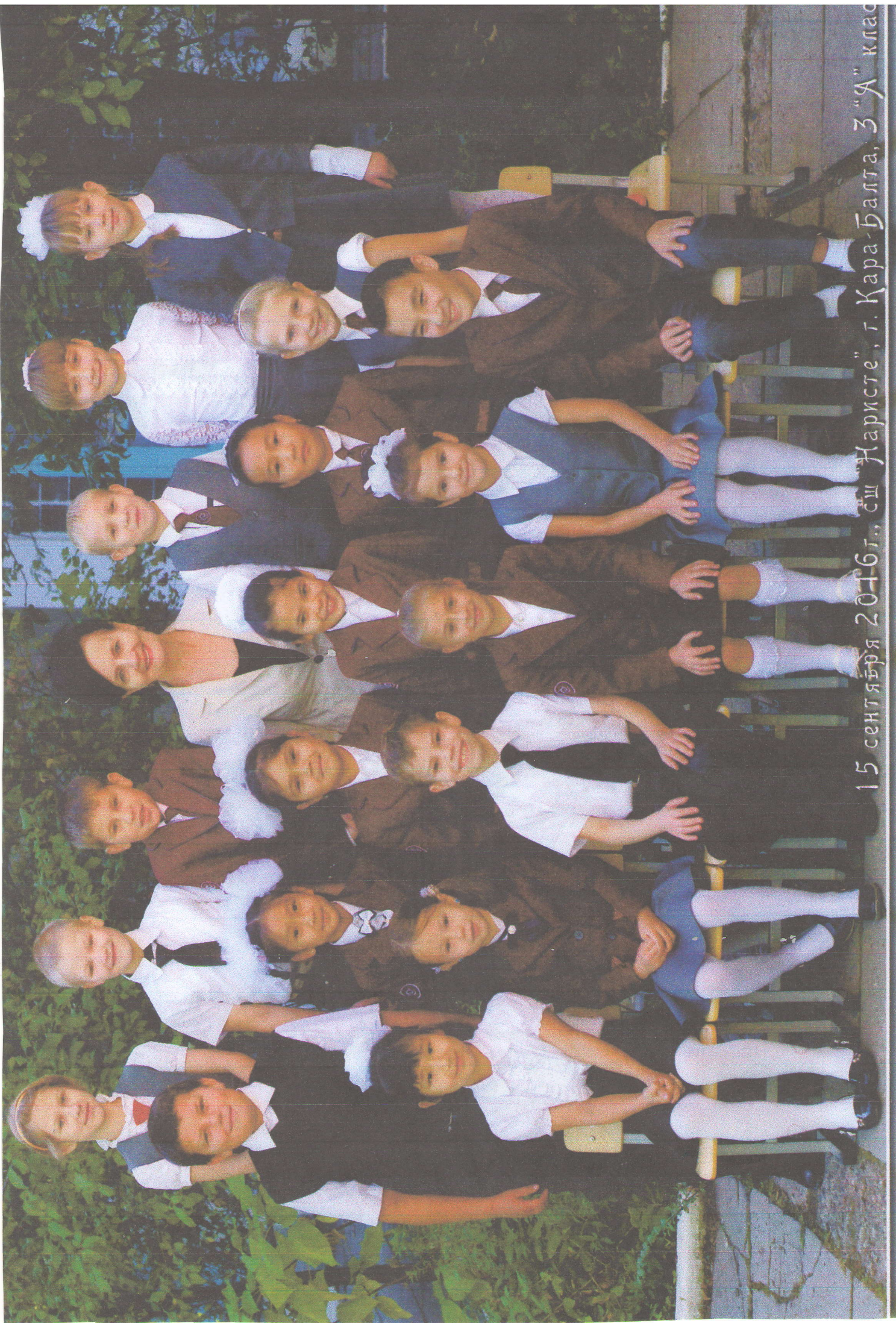
15 септѣря 2016 г., сш "Жаристе", г. Кара-Балга, 3 "А" клас